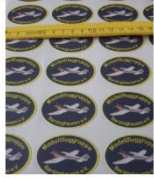
Aufkleber klein (kostenlos)